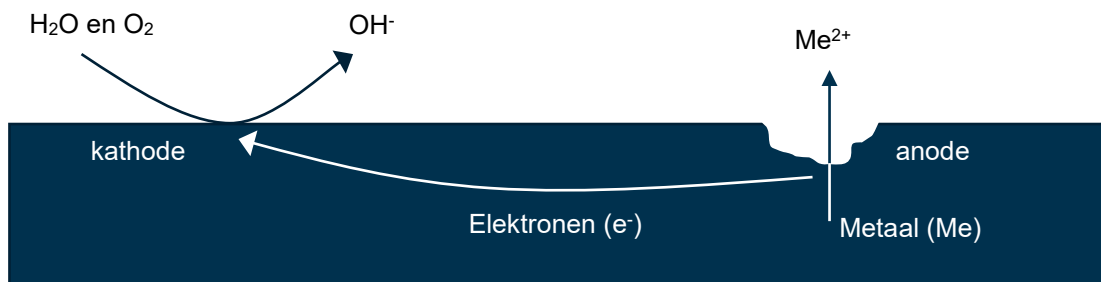
Figuur B1. 1 Schematische weergave van corrosie van een metaal (Me)

Corrosie is een proces waarbij metalen worden aangetast als gevolg van een elektrochemische reactie met de omgeving. Bij corrosie worden enerzijds metaalatonen geoxideerd en anderzijds stoffen gereduceerd. De elektronen die bij de oxidatiereactie vrijkomen, stromen door het metaal heen om elders te worden gebruikt in de reductiereactie. Om een gesloten elektrisch circuit te krijgen, is een elektrolyt nodig. Dat is een medium waarin lading (ionen) zich vrijelijk kan bewegen. De plek waar oxidatie optreedt, heet de anode en de plek waar reductie optreedt, heet de kathode.