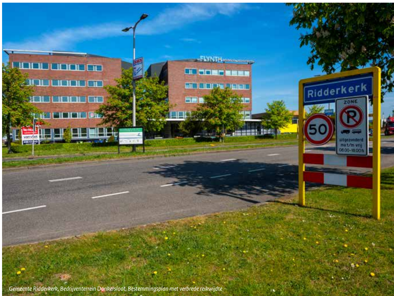
Gemeente Ridderkerk, Bedrijventerrein Donkersloot, Bestemmingsplan met verbrede reikwijdte