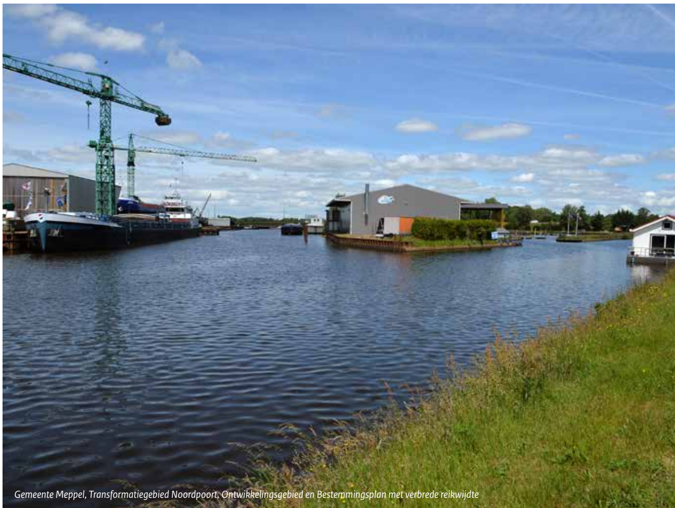
Gemeente Meppel, Transformatiegebied Noordpoort, Ontwikkelingsgebied en Bestemmingsplan met verbrede reikwijdte