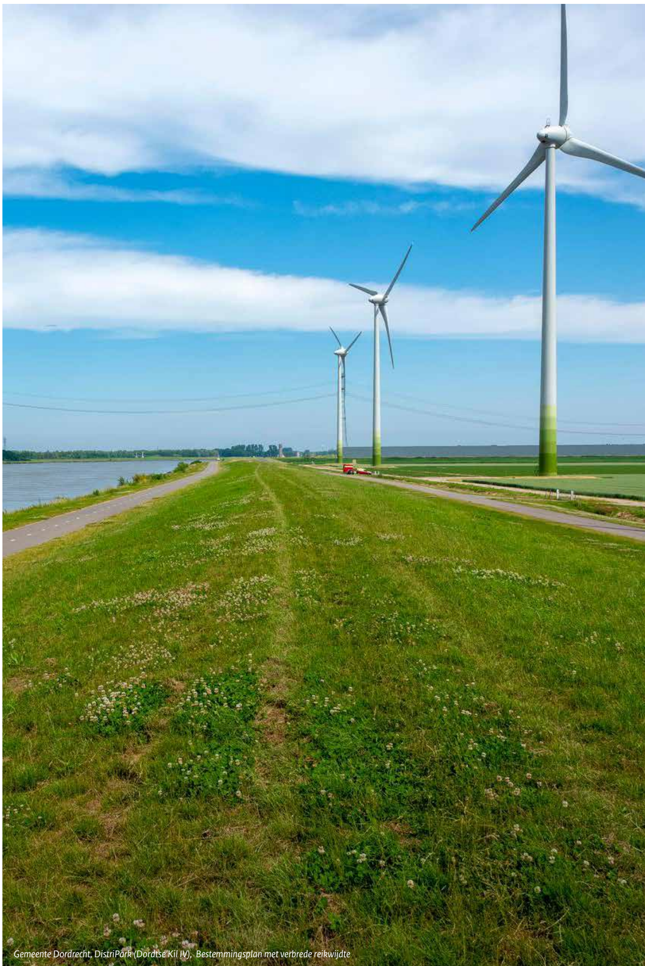
Gemeente Dordrecht, DistriPark (Dordtse Kil IV), Bestemmingsplan met verbrede reikwijdte