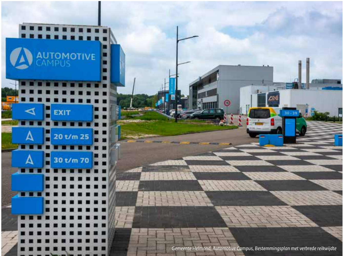
Gemeente Helmond, Automotive Campus, Bestemmingsplan met verbrede reikwijdte