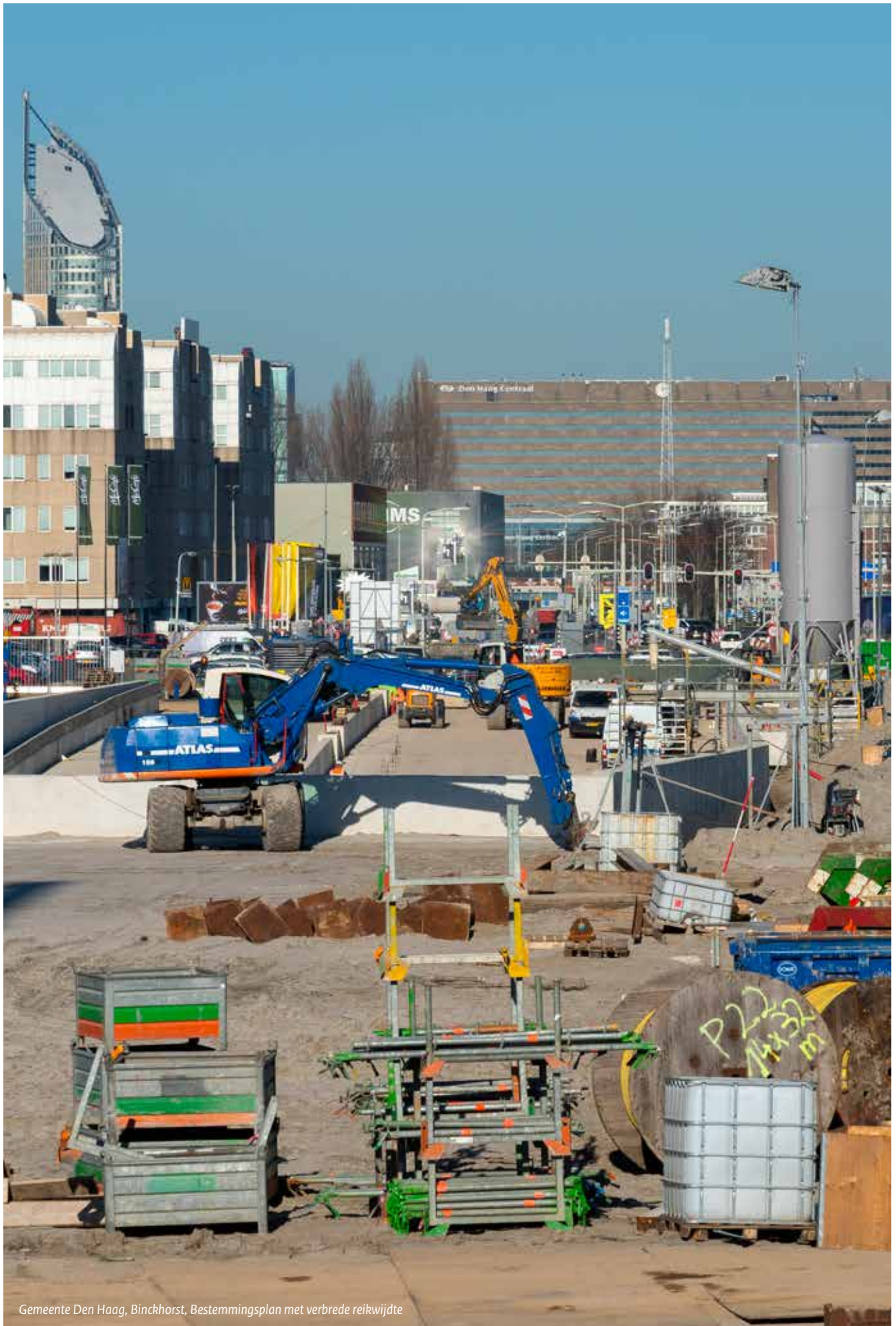
Gemeente Den Haag, Binckhorst, Bestemmingsplan met verbrede reikwijdte