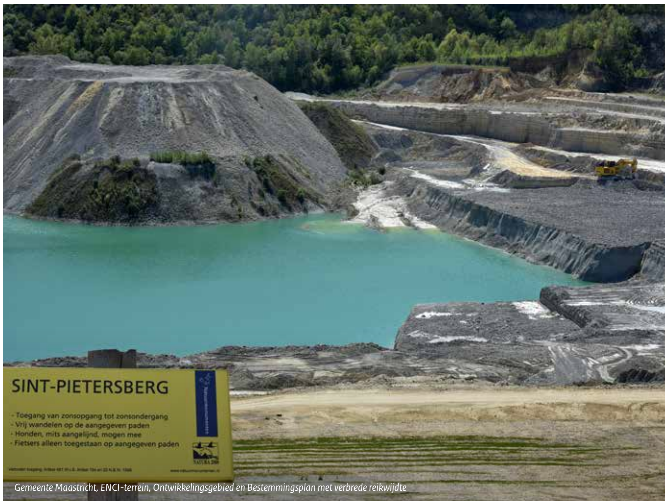
Gemeente Maastricht, ENCI-terrein, Ontwikkelingsgebied en Bestemmingsplan met verbrede reikwijdte

De Chw maakt het mengpaneel van Transformatiegebied Noordpoort op een paar manieren mogelijk. De schuifjes van het mengpaneel gaan over meer dan alleen een goede ruimtelijke ordening. De verbrede reikwijdte van het experiment maakt ook een schuifje voor bijvoorbeeld leefbaarheid en duurzame werkgelegenheid mogelijk. De tweede hulp van de Chw gaat over de koppeling van het mengpaneel aan het verlenen van toestemming voor een activiteit. Voor de invulling van een deelgebied is een omgevingsvergunning nodig voor een bestemmingsplanactiviteit. De bestemmingsplanactiviteit maakt onderdeel uit van het Chw-experiment. De omgevingsvergunning wordt alleen verleend als voldoende schuifjes uit het mengpaneel goed staan (en tenminste neutraal scoren). Verder is bij de invulling van het mengpaneel gebruik gemaakt van beleidsregels, die gekoppeld zijn aan een open norm in het plan.