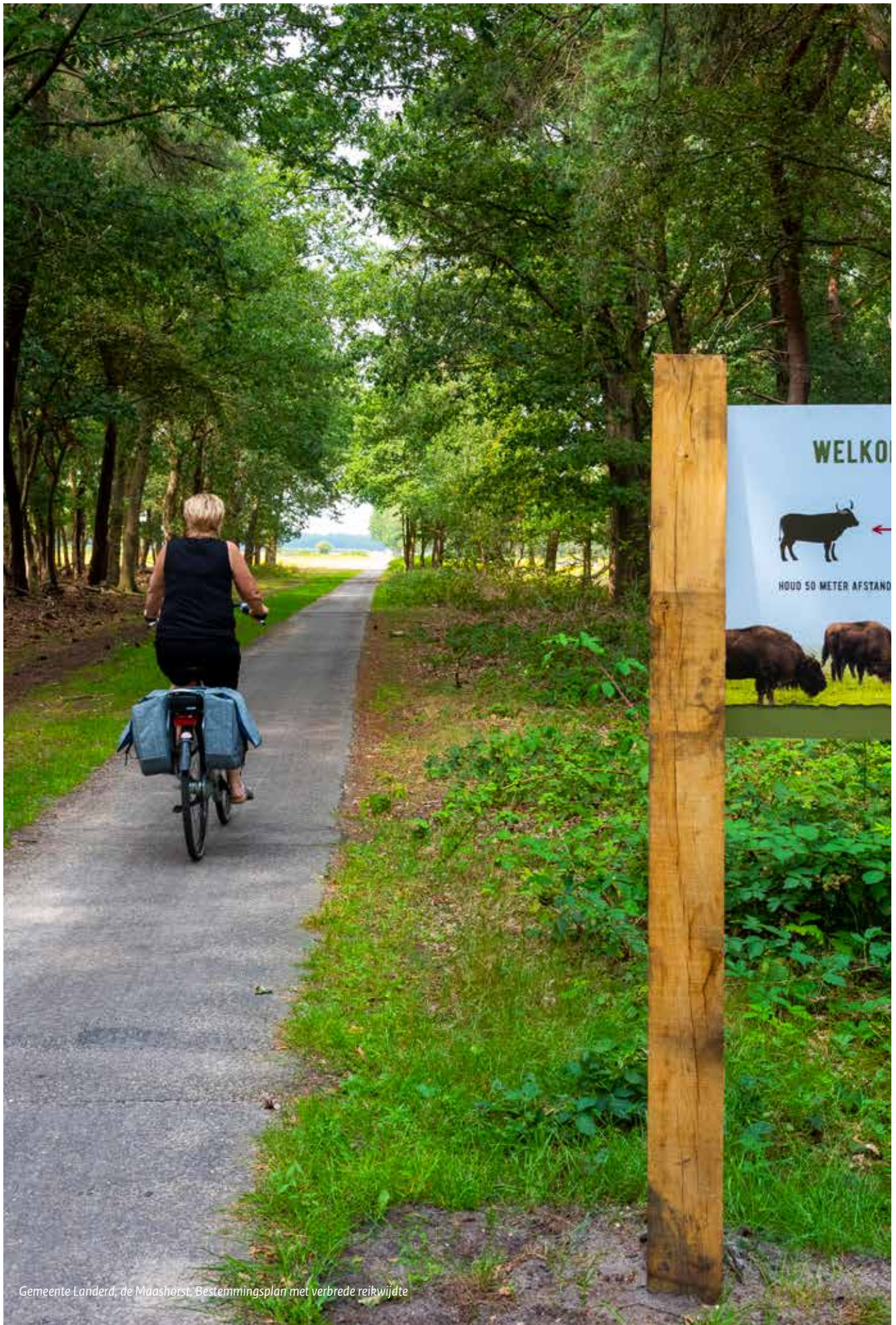
Gemeente Landerd, de Maashorst, Bestemmingsplan met verbrede reikwijdte