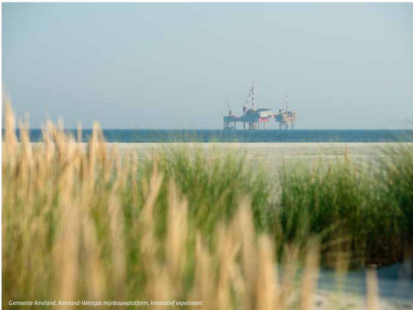
Gemeente Ameland, Ameland-Westgat mijnbouwplatform, Innovatief experiment