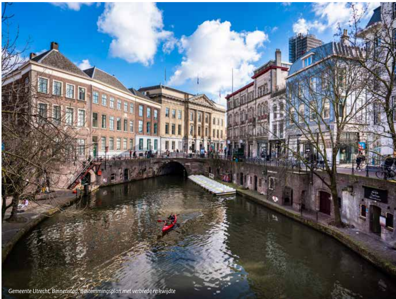
Gemeente Utrecht, Binnenstad, Bestemmingsplan met verbrede reikwijdte