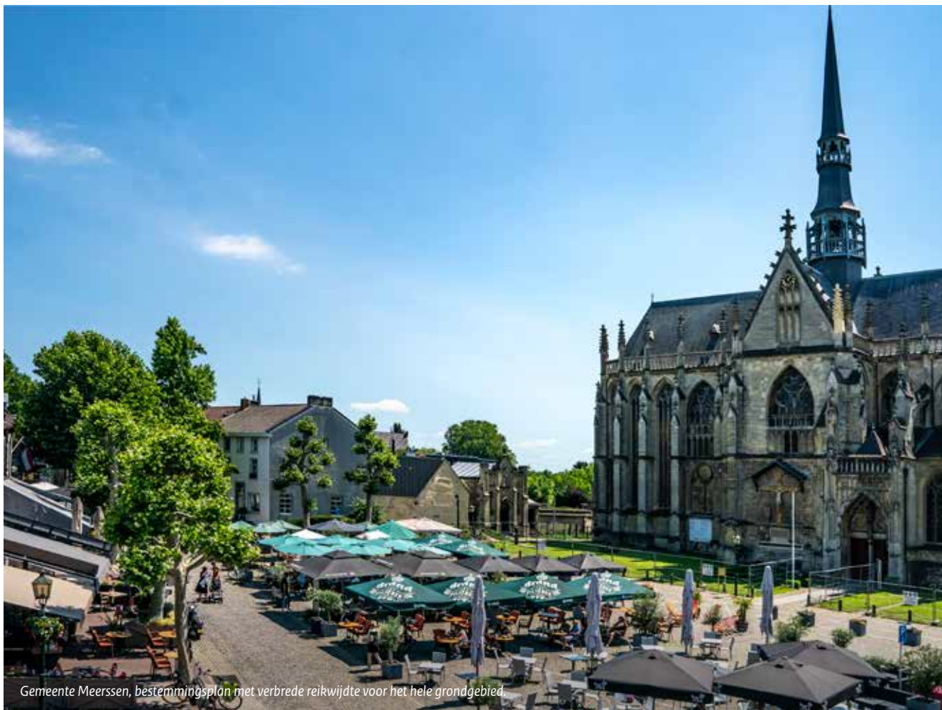
Gemeente Meerssen, bestemmingsplan met verbrede reikwijdte voor het hele grondgebied.