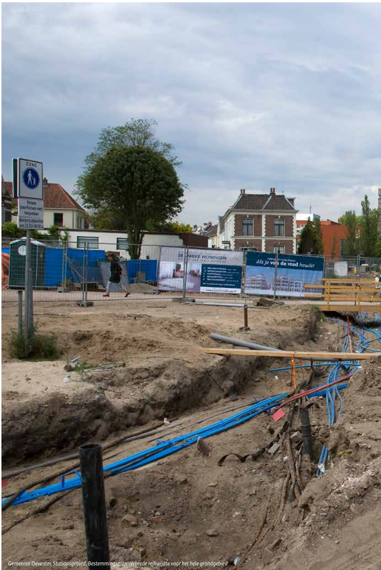
Gemeente Deventer, Stationsgebied, Bestemmingsplan verbrede reikwijdte voor het hele grondgebied