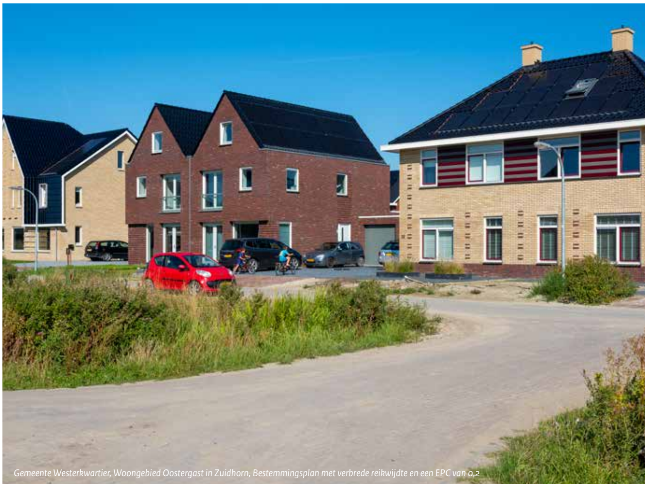
Gemeente Westerkwartier, Woongebied Oostergast in Zuidhorn, Bestemmingsplan met verbrede reikwijdte en een EPC van 0,2

behaalt goede resultaten. Bij hoogbouw blijkt het soms lastig om te voldoen aan de 1 e traps-eis, dat EPC zonder gebiedsmaatregelen moet worden gehaald. Voor de Binckhorst in Den Haag blijkt de verlaagde EPC-norm een goede ingang om met initiatiefnemers in gesprek te gaan over de oplossingen die de gemeente voorstaat voor energie en warmte. De EPC-norm is echter niet voldoende, de gemeente bereid aanvullende plan- of beleidsregels voor om de gewenste oplossingen af te dwingen.