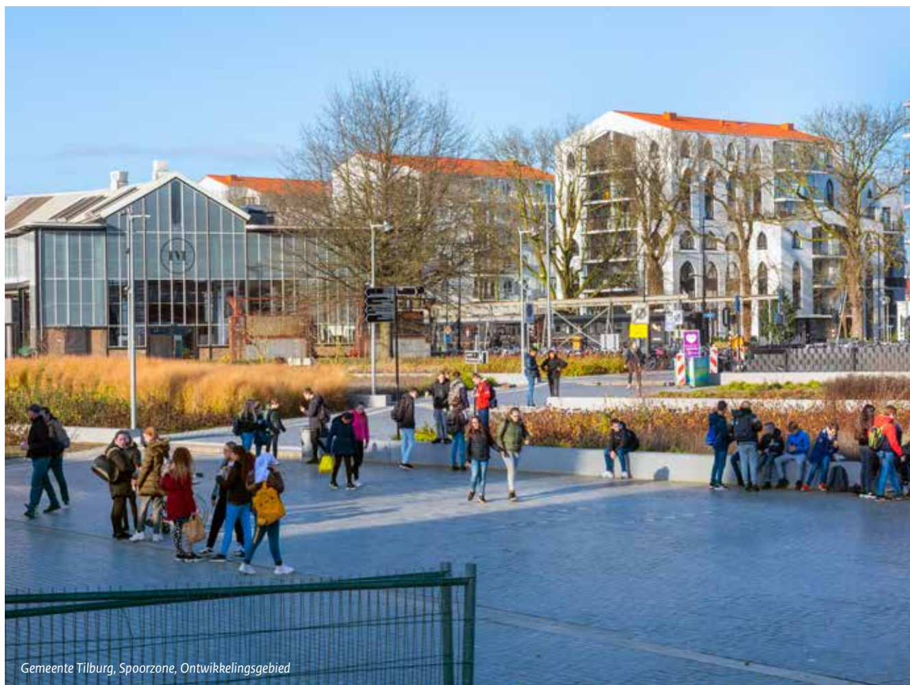
Gemeente Tilburg, Spoorzone, Ontwikkelingsgebied