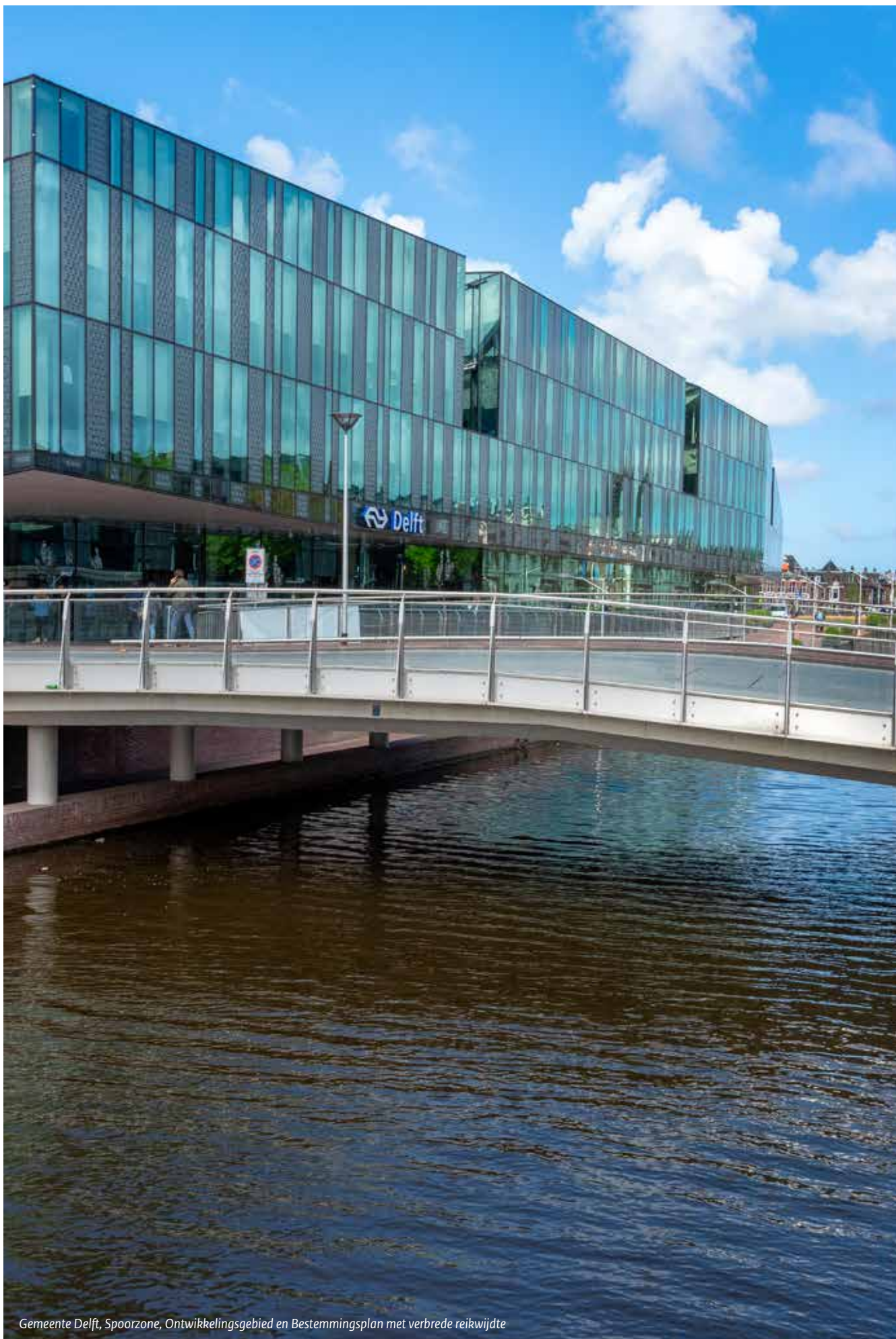
Gemeente Delft, Spoorzone, Ontwikkelingsgebied en Bestemmingsplan met verbrede reikwijdte