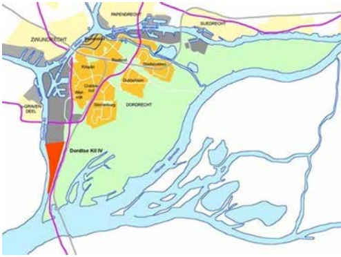
Ligging bedrijventerrein DistriPark Dordrecht (Dordtsew Kil IV) met rood aangegeven.

Zeedijk, de rivier de Dordtsche Kil en rijksweg A16 met parallelstructuur en de spoorlijn.