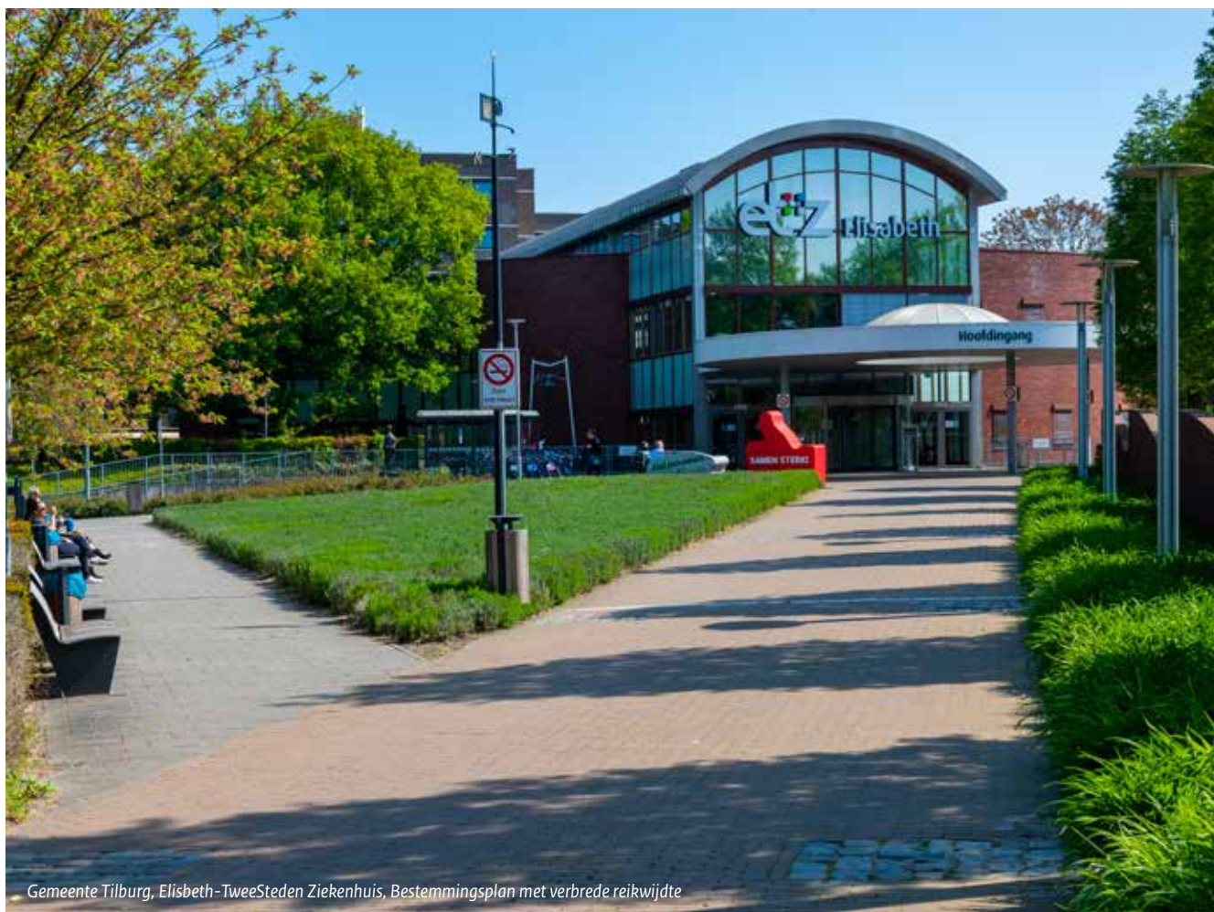
Gemeente Tilburg, Elisabeth-TweeSteden Ziekenhuis, Bestemmingsplan met verbrede reikwijdte