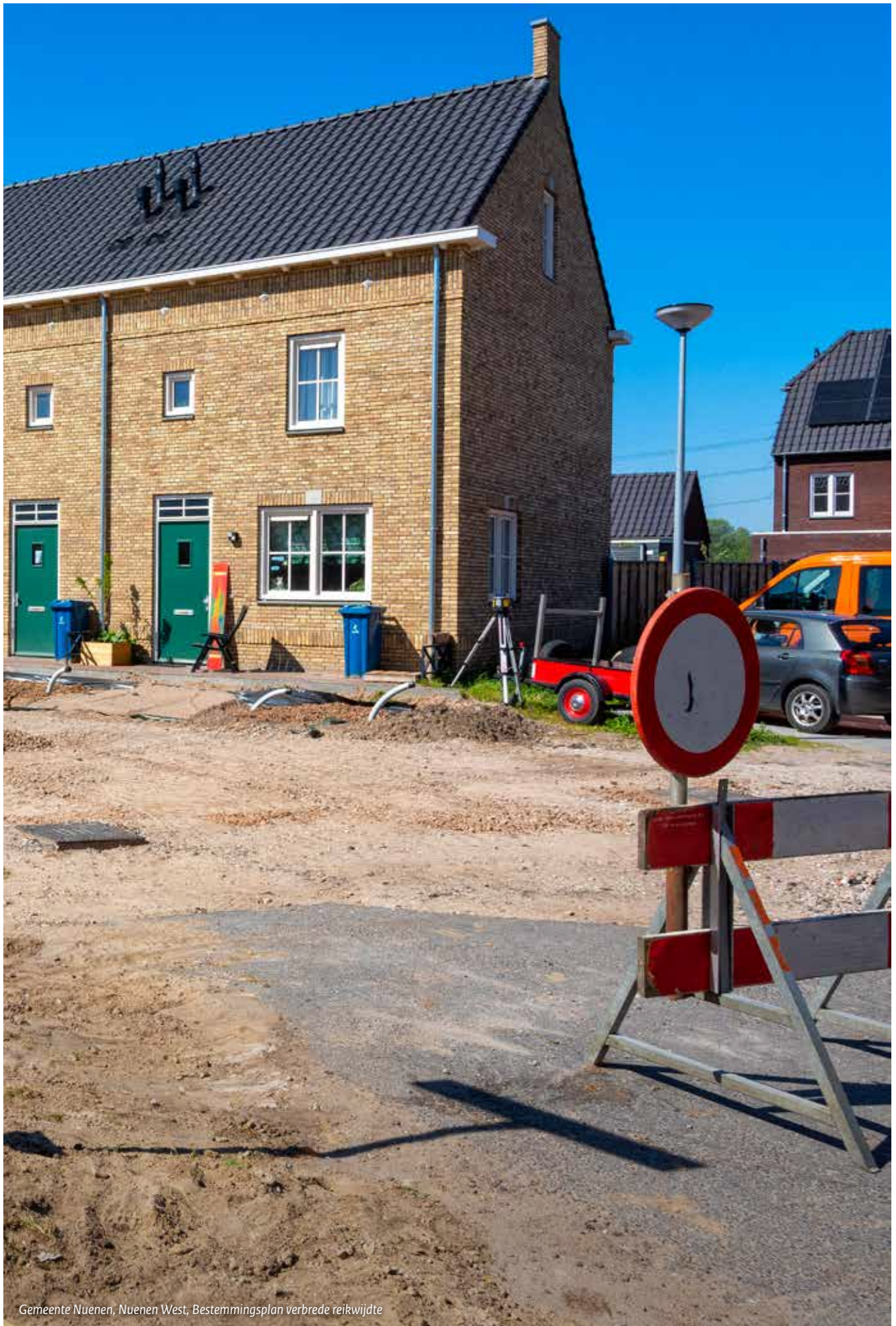
Gemeente Nuenen, Nuenen West, Bestemmingsplan verbrede reikwijdte