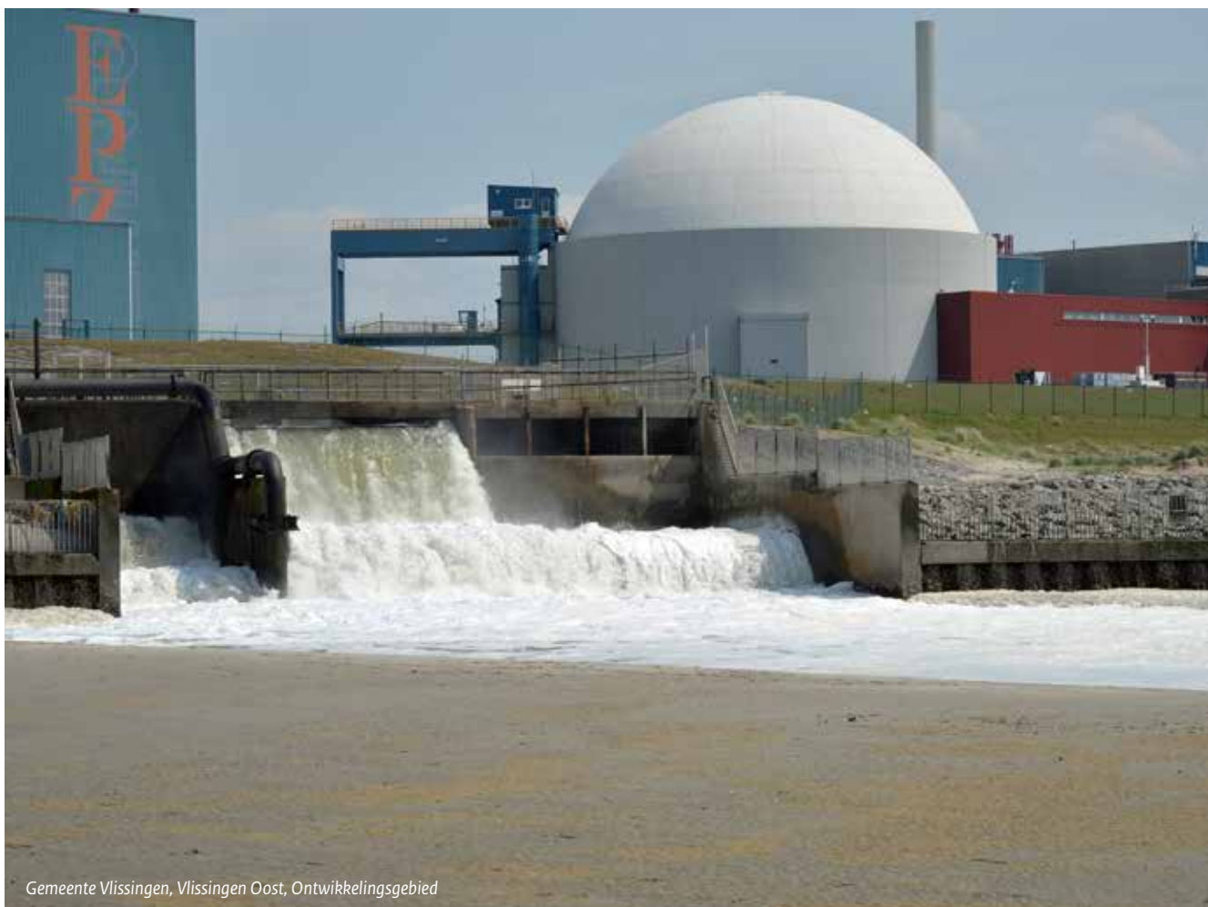
Gemeente Vlissingen, Vlissingen Oost, Ontwikkelingsgebied

Waar dat zinvol is worden in dit hoofdstuk wel specifieke punten van het ontwikkelingsgebied benoemd. Ook is aan het slot van dit hoofdstuk het Transformatiegebied Noordpoort in Meppel toegelicht, waarin beide instrumenten (verbrede reikwijdte én ontwikkelingsgebied) worden ingezet voor de transitieopgave.