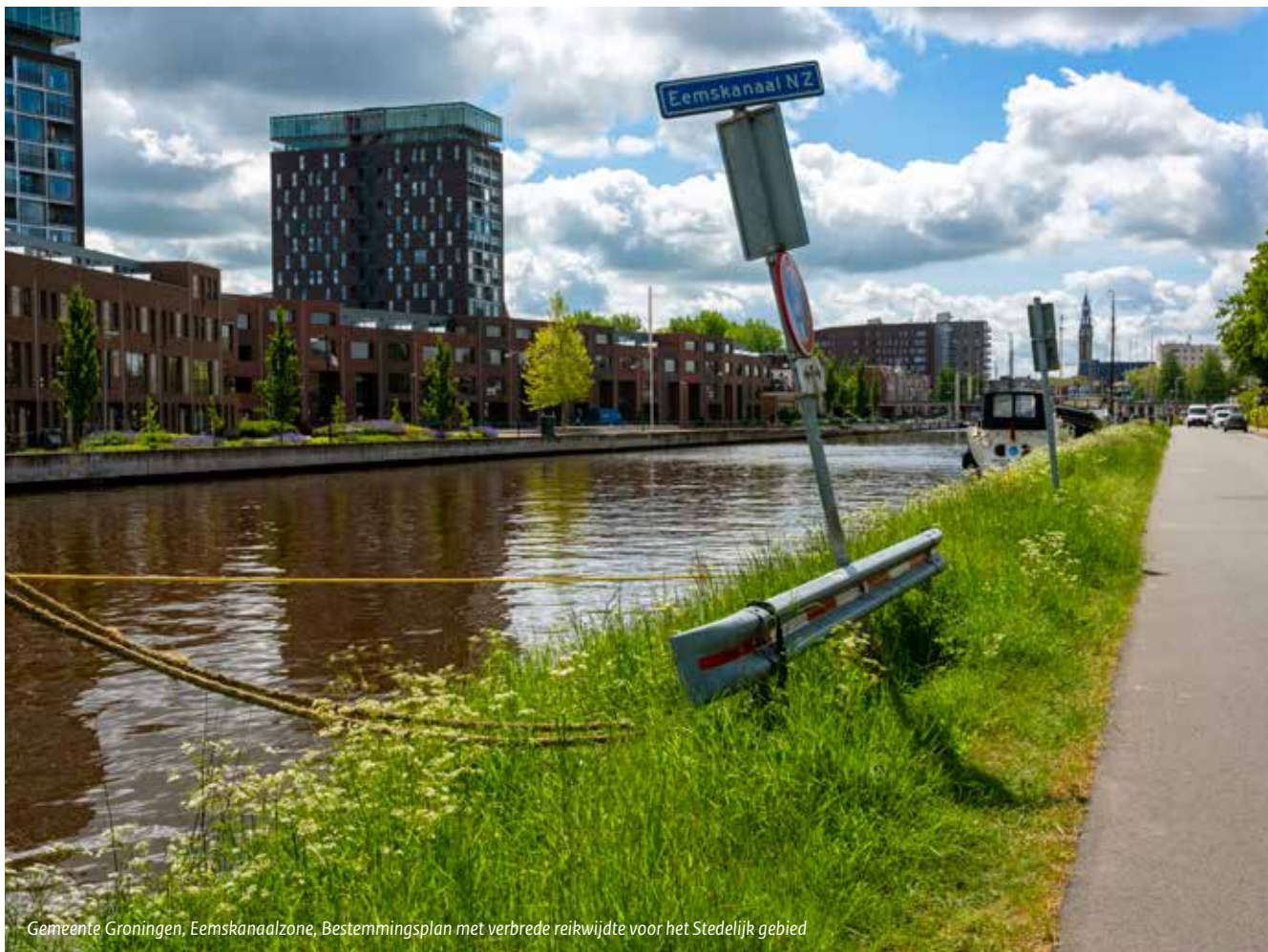
Gemeente Groningen, Eemskanaalzone, Bestemmingsplan met verbrede reikwijdte voor het Stedelijk gebied