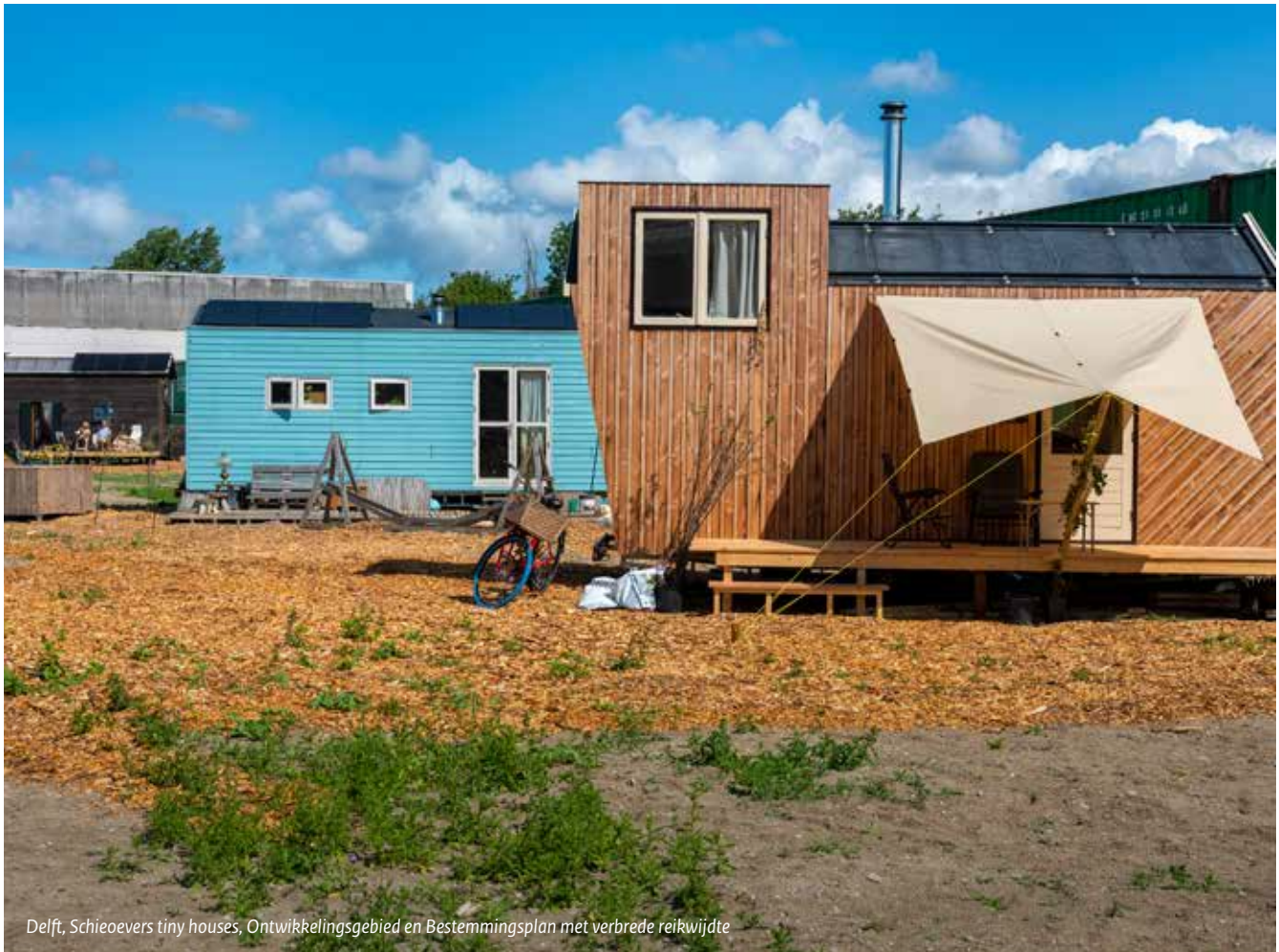
Delft, Schieoevers tiny houses, Ontwikkelingsgebied en Bestemmingsplan met verbrede reikwijdte