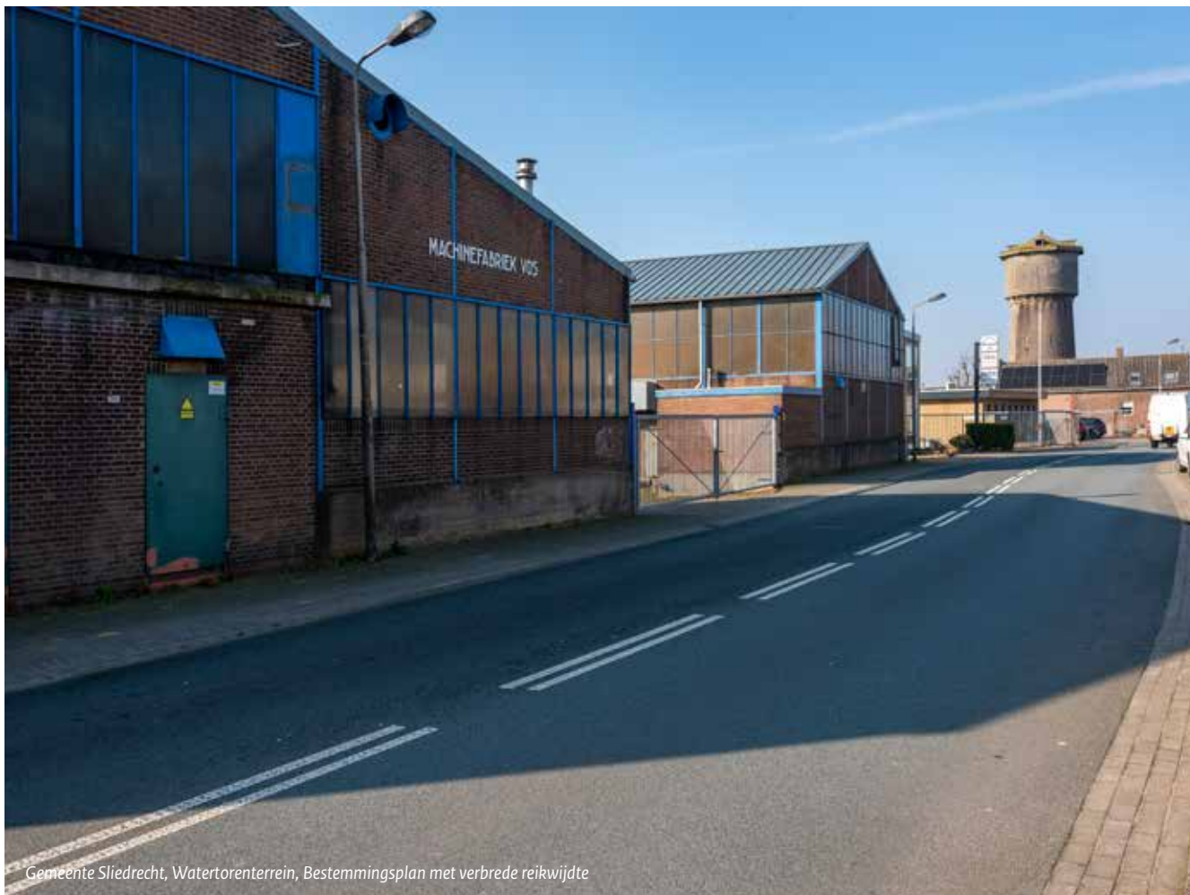
Gemeente Sliedrecht, Watertorenterrein, Bestemmingsplan met verbrede reikwijdte

De naamgever van het experiment 'verbrede reikwijdte' wordt het meest genoemd. Hierdoor kan een breder scala aan onderwerpen in het bestemmingsplan worden geregeld, die een samenhangende ontwikkeling van het plangebied mogelijk maakt. Een gemeente noemt expliciet dat de vastlegging en waarborg in het plan bijdraagt aan het vertrouwen en draagvlak bij stakeholders. Op plek twee staat 'beleidsregels'. De flexibele sturing die daarmee kan worden verkregen staat veel gemeenten aan. Op de derde plek komt 'faseren van het kostenverhaal' dat past bij de globale opzet van diverse plannen. Bij de invulling van het plan op een later moment ontstaat immers pas goed inzicht in de financiële exploitatie.