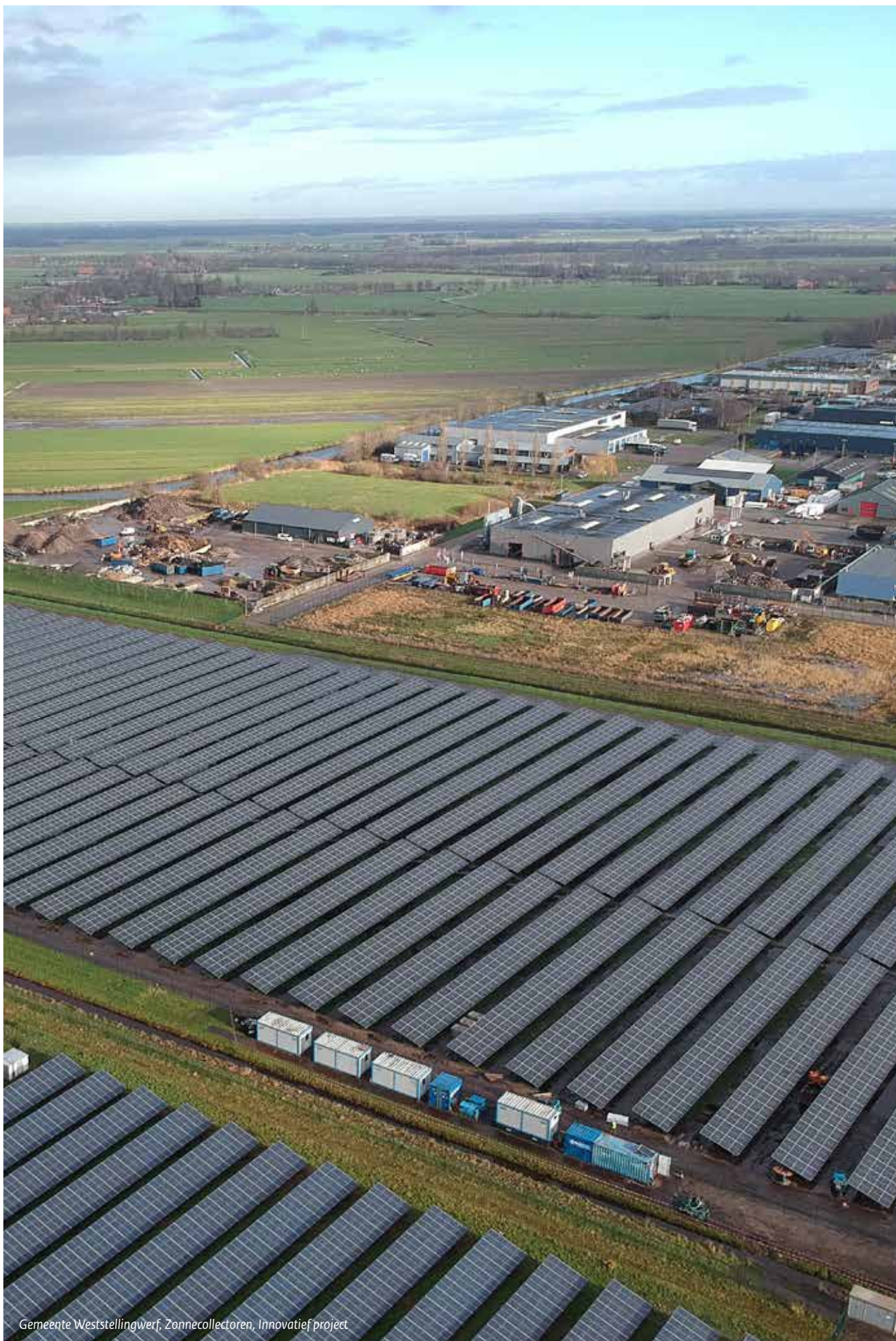
Gemeente Weststellingwerf, Zonnecollectoren, Innovatief project