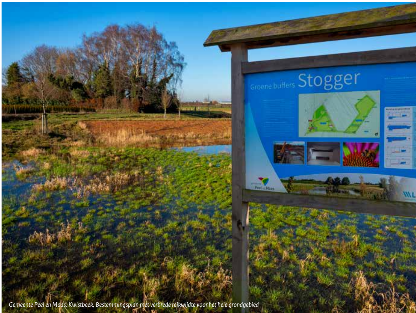
Gemeente Peel en Maas, Kwistbeek, Bestemmingsplan met verbrede reikwijdte voor het hele grondgebied

instrumentarium van de Chw uit om met nieuwe initiatieven te komen. Zicht op eigen uitvoering ontbreekt. Om zelf maatregelen te treffen heeft de Gemeenteraad wel budget beschikbaar gesteld, maar ontbreekt een uitvoeringsplan. De besteding van het budget is geen onderdeel van de formele procedure die gemeente en waterschap samen doorlopen. Dat is voor de inwoners wel wat onduidelijk. Ook wijkt de schrijfwijze en opbouw van de beide documenten flink af van de toonzetting in de gesprekken met de inwoners. In een 'verbindingsdocument' wordt de link gelegd tussen de afspraken in gewone mensentaal en de stukken die ter inzage liggen. Een goed stuk noemen de betrokkenen het verbindingsdocument. Jammer dat zoiets nodig is. Door de Coronaperikelen komt het stuk ook niet goed uit de verf. In de besluitfase zijn overleggen tot een minimum beperkt en is weinig ruimte voor uitleg van persoon tot persoon. Eerder bleken juist die een op een gesprekken bij inloopbijeenvakomen heel verhelderend.