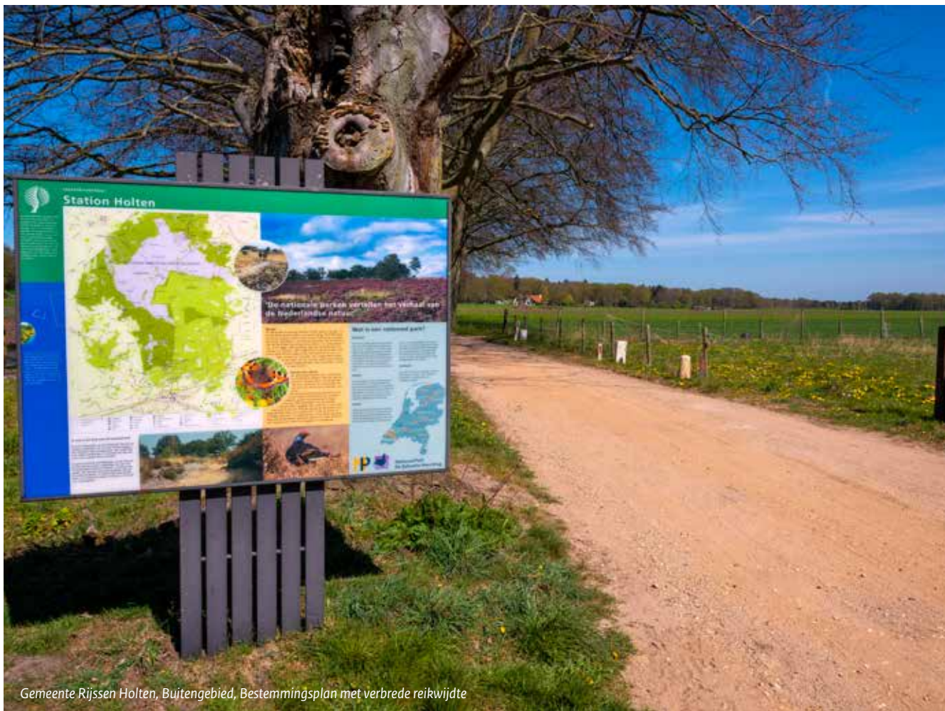
Gemeente Rijssen Holten, Buitengebied, Bestemmingsplan met verbrede reikwijdte

Toch borrelen ook op het digitale vlak nog veel ideeën op. Wat zou het mooi zijn om de werkelijkheid met een drie dimensionale weergave nog beter te benaderen (een wens die vooral speelt bij het nog op te stellen omgevingsplan Kernen) of om de milieuregels in de vorm van zoneringen op kaart te zetten. Het is ideaal als iedereen met een eenvoudige ‘klik’ op de kaart kan zien wat op die locatie wel of niet mogelijk is en aan welke randvoorwaarden moet worden voldaan. Of helemaal klantvriendelijk: een eigen plan inlezen en dan een eerste toets terugkrijgen of dat plan mogelijk is.