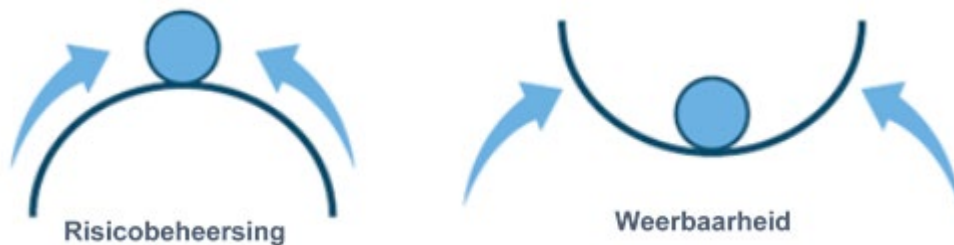
Figuur 6.1 Verschil tussen risicogedreven inrichting van plantgezondheid en een op weerbaarheid gefundeerde aanpak. (Uit: Erisman et al., 2016. AIMS Agriculture and Food Volume 1, Issue 2, 157-174)

Daaronder worden in het UP de componenten besproken die een bijdrage leveren aan de weerbaarheid. Daarin is een opbouw in schaalniveaus te herkennen: