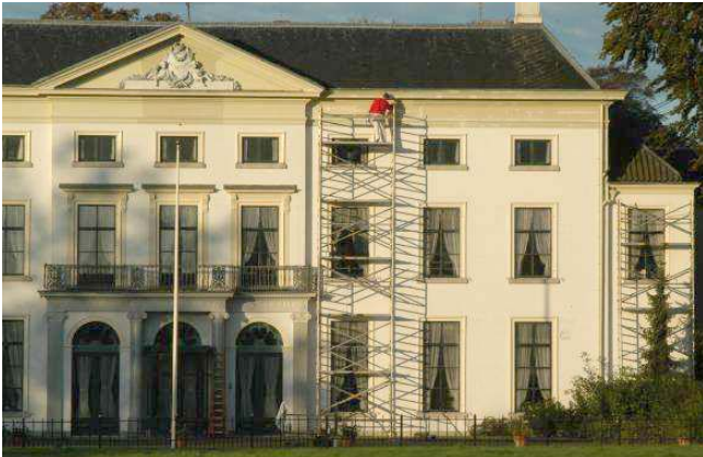
In dezelfde kleur overgeschilderd: vergunningvrij

Voorbeelden van werkzaamheden waar voor de Wabo-activiteit wijzigen van het rijksmonument geen vergunning nodig is.