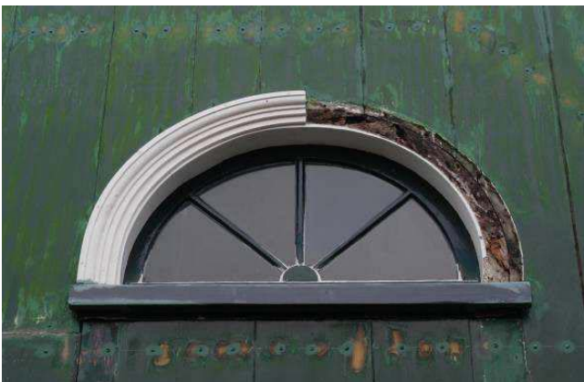
Herstel houtwerk vergunningvrij als detaillering, profilering, vormgeving, materiaalsoort en kleur dezelfde blijven