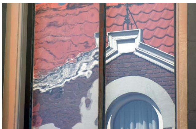
Vervanging van oorspronkelijk mondgeblazen glas (links) door modern glad floatglas (rechts), beide in een oud raam. Vergunning nodig.