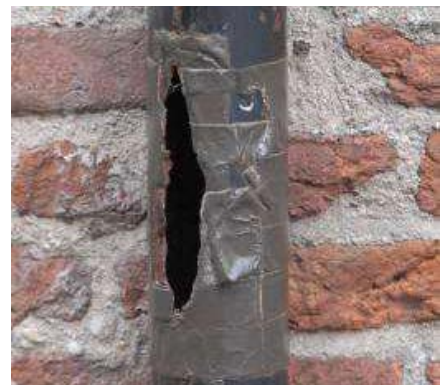
Kapotte delen van de hemelwaterafvoer met hetzelfde materiaal vervangen: vergunningvrij