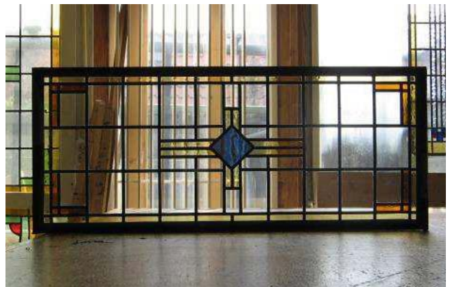
Glas-in-loodraam uitgenomen, hersteld en met dezelfde glassoort teruggeplaatst: vergunningvrij