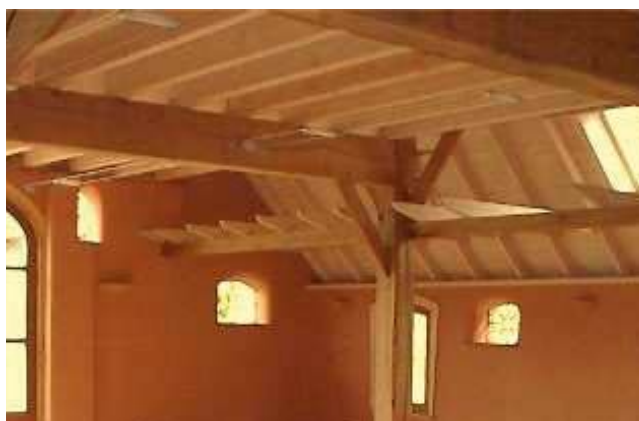
Aanbrengen binnenisolatie. Vergunning nodig.