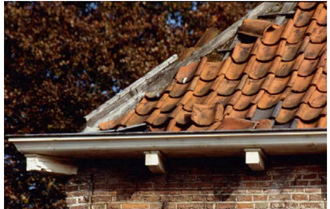
Herstel lood en pannen conform bestaande toestand: vergunningvrij