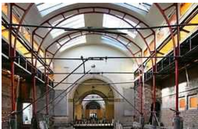
Volledig cascoherstel. Vergunning nodig.