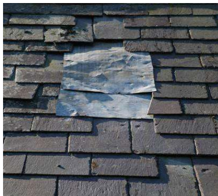
Herstel leiwerk conform bestaande toestand: vergunningvrij