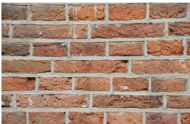
Volledig vervangen van voegwerk. Vergunning nodig.

Voorbeelden van werkzaamheden waar voor de Wabo-activiteit wijzigen van het rijksmonument wel een vergunning nodig is.