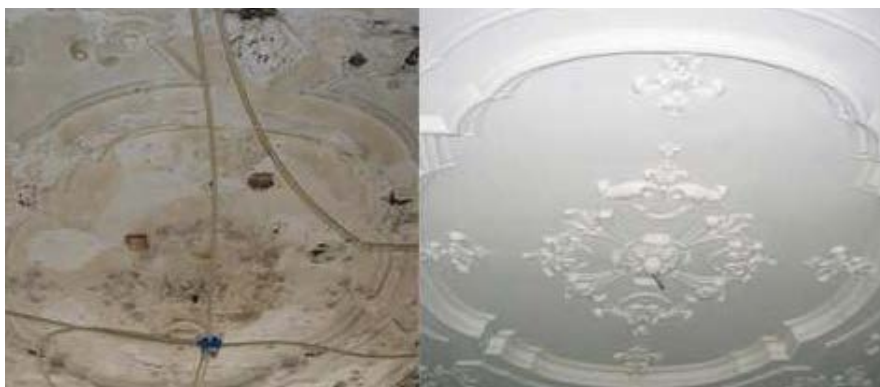
Geen onderhoud, maar restauratie. Vergunning nodig.