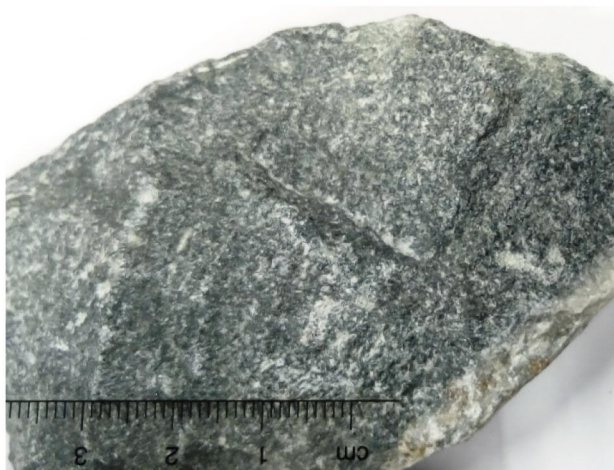
Figuur 1: Bestone ®