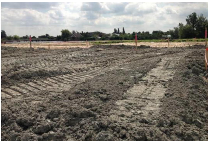
Figuur 5: Granuliet toegepast in een terreinophoging in Roelofarendsveen 2

Bij de verwerking van gesteenten komt fijn materiaal vrij. Hiervoor wordt eveneens de benaming 'granuliet' gebruikt. Onderstaande slaat op het fijne materiaal dat vrijkomt bij verwerking van gesteente. Figuur 5 laat een toepassing zien van granuliet 1 in een terreinophoging.