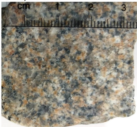
Figuur 3: Graniet (Glensanda)