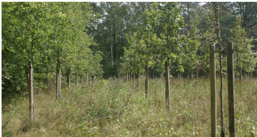
Figuur 5: Aanplant identieke soorten in rij met gelijke onderlinge afstand