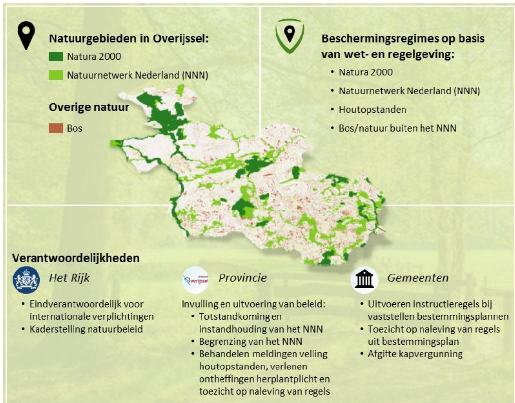
Figuur 3: Introductie natuurbeschermingsbeleid provincie Overijssel