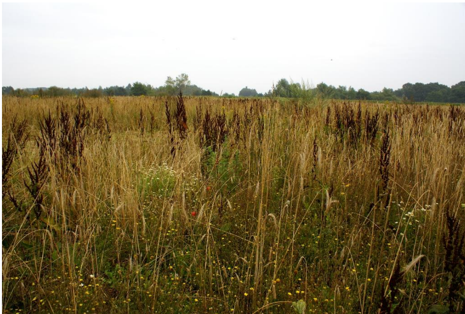
Figuur 2: Compensatieperceel Diffelen; natuurdoeltype “kruiden- of faunarijke akker”

Bij compensatie van het NNN gaat het niet alleen om compensatie van de oppervlakte die wordt aangetast door een ingreep, maar ook om compensatie van de natuurkwaliteit en de samenhang van natuurgebieden. De kwaliteit van de natuur wordt ingedeeld in verschillende typen. Een voorbeeld is het natuurtype “fauna- of kruidenrijke akker”. Kenmerkend voor dit type is dat het gewas ruim is ingezaaid. De openheid biedt ideale mogelijkheden voor insecten, muizen en akkervogels. Ook komen er voornamelijk kruiden voor en weinig grasachtige soorten. In figuur 2 is een voorbeeld te zien van een compensatieperceel waarbij een akker is ingezaaid met rogge, waarbij het beheer is gericht op natuurkwaliteit.