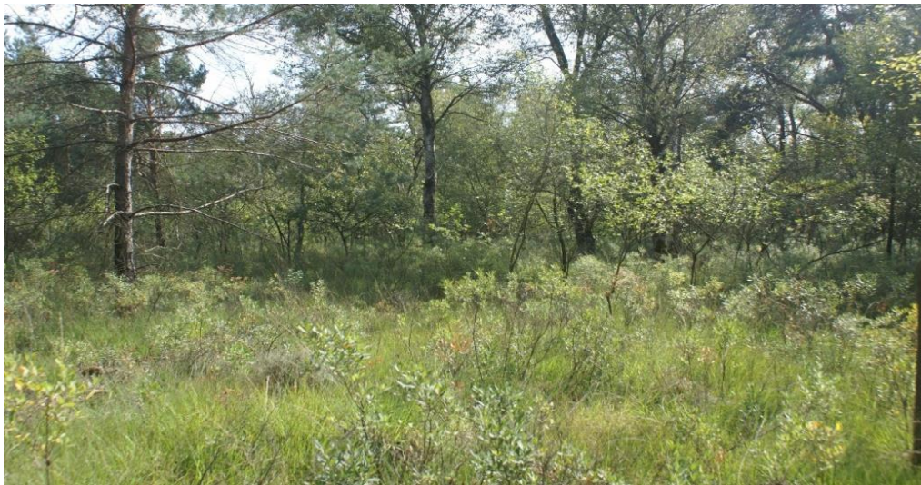
Figuur 6: Compensatielocatie voor boscompensatie met zeldzame gagelstruiken