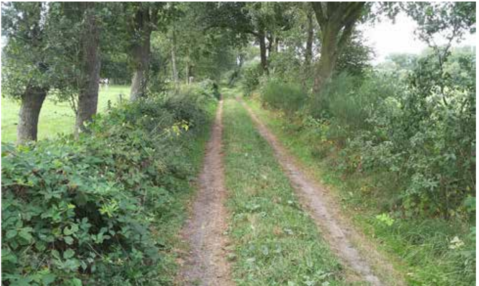
Een zandpad in het Dommeldal.

Om de beleidsmakers het gevoel van urgentie van het behoud van zandpaden bij te brengen, moet er kennis van de verschillende kwaliteiten van de zandpaden worden overgedragen. De bescherming van de waarden verdient een goede regeling. Regels moeten worden nageleefd en toezicht en handhaving moet prioriteit krijgen. In het omgevingsplan hebben gemeenten meer ruimte om lokale waarden te beschermen.