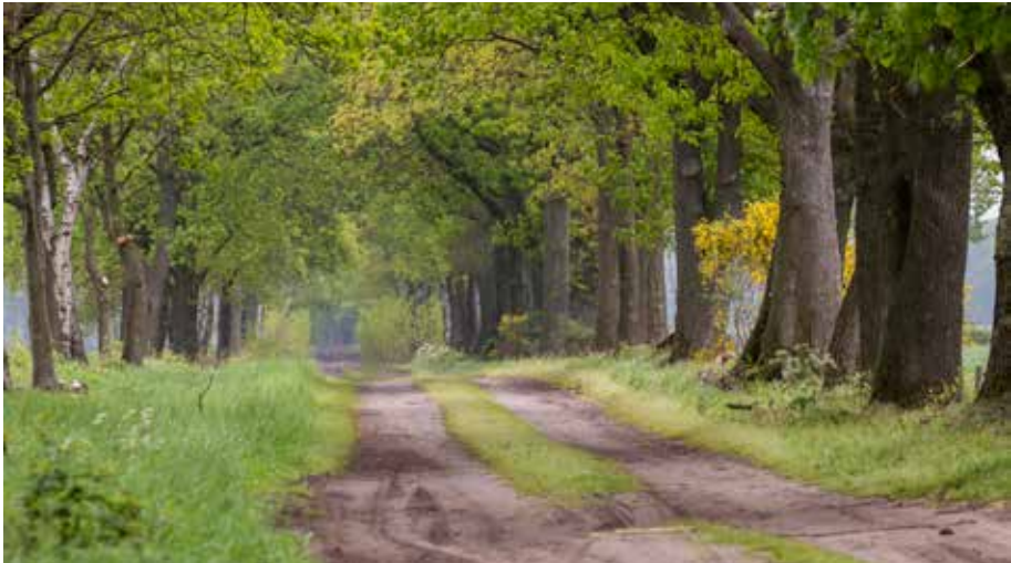
De Strontbaan in Baarle-Nassau.

De natuur- en milieugroepen stelden dat niet is voldaan aan de voorwaarde dat er geen onevenredige afbreuk is gedaan aan het behoud, herstel en de ontwikkeling van de CHW-waarden van de gronden. Het gaat hier niet om slechts een beperkte ingreep ten opzichte van de totale lengte van de Scheidijk, nu de helft van de weg wordt verhard en zandpaden onderdeel uitmaken van de karakteristieke kwaliteiten van het gehele landgoed.