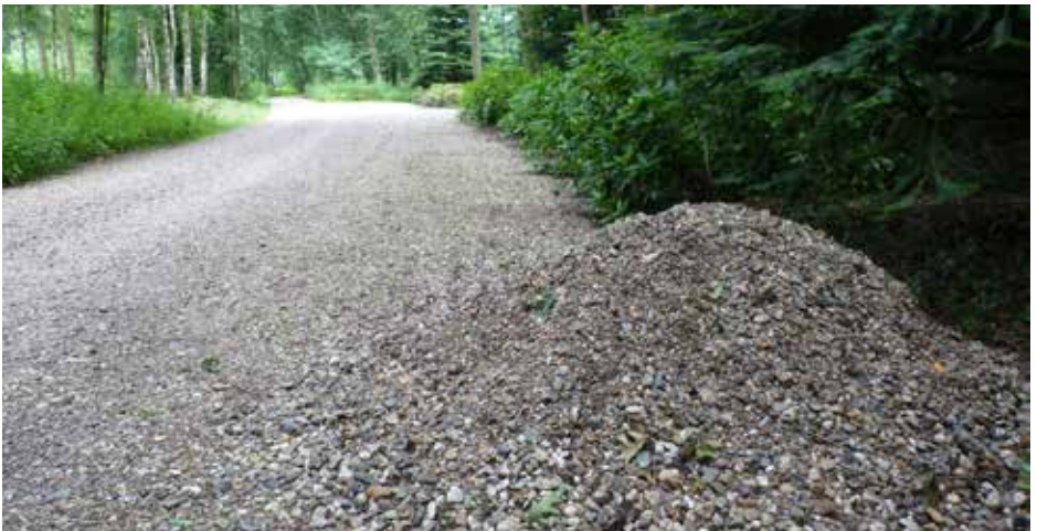
Verharding van een zandpad in de Tipmast in Bergeijk.

De derde kwestie gaat over een aanlegvergunning voor onder andere de verharding van een zandpad De Slingerdijk te Reusel de Mierden (zaaknummer SHE 16/ 3519 Rechtbank Oost-Brabant). De beschermde cultuurhistorische waarde van de Slingerdijk