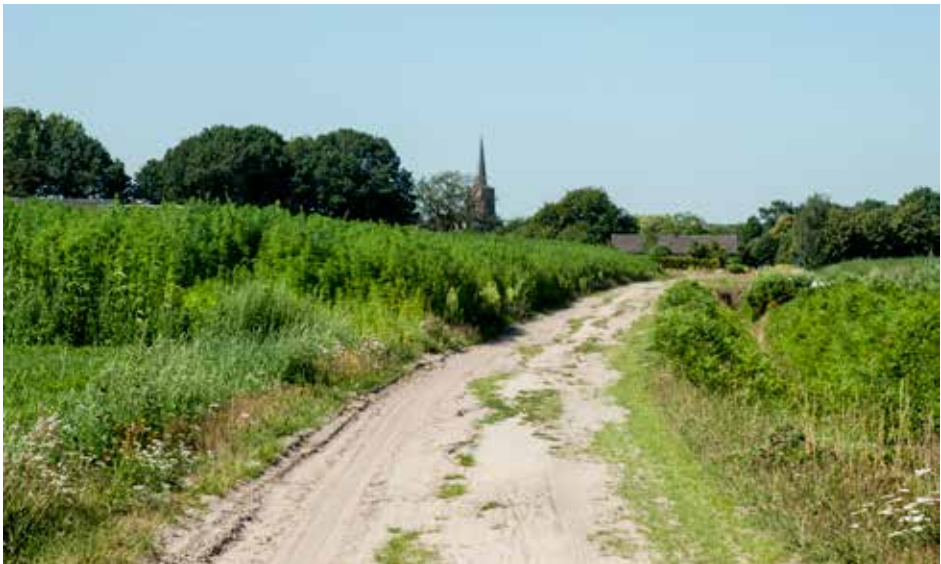
Deze foto van de Tilburgebaan in Alphen laat goed zien hoe zandpaden van oorsprong verbindingswegen zijn.

De identiteit van een streek is leesbaar. De ontginningsgeschiedenis valt af te leiden uit de zandpaden. Maar ook de waarde vanuit de geschiedenis is van belang. De zandpaden vertellen een verhaal. Wie kent niet de vele Franse banen in Zuid-Nederland waarvan er een aantal nog zandpad zijn? Vele voeten van Franse soldaten en paardenhoeven hebben zich erover voortbewogen.