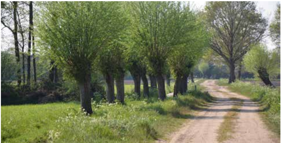
Hoe mooi een zandweg kan zijn laat dit juweeltje zien in de buurt van Overloon.

De bescherming is dus afhankelijk van de bestemming en wat er in de bijbehorende regels staat. Een voorbeeld hiervan is de bestemming ‘Verkeer’, eventueel met dubbelbestemming ‘Waarde attentiegebied’ en met de aanduiding onverhard of halfverhard.