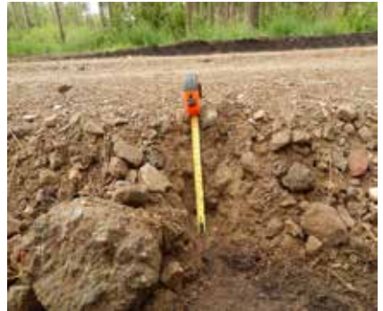
Een dikke laag puin op een zandpad.

In de Boswachterij Chaam dreigt halfverharding van de eeuwenoude, cultuurhistorisch waardevolle Oude Maastrichtsebaan door Staatsbosbeheer dat het natuurbos wil exploiteren. Ook zandpaden in de bossen van Eersel en Bladel werden van een laag puinverharding voorzien.