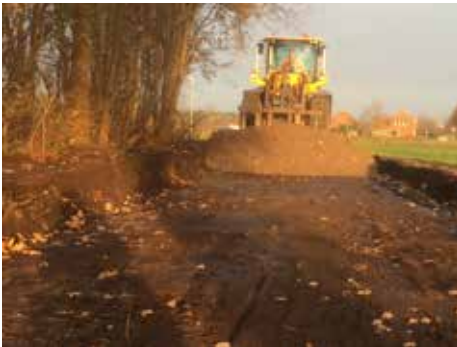
Een zandpad wordt verhard met menggranulaat. Een voorbeeld van het verdwijnen van een zandpad.

Gelukkig bleef, met name door acties vanuit de gemeenschap, de Rooversdijk gespaard van verharding. De gemeente Hilvarenbeek wilde deze eeuwenoude weg naar Poppel in België verharden, zogenaamd om economische redenen. Een petitie werd in vijf dagen tijd 650 keer ondertekend.