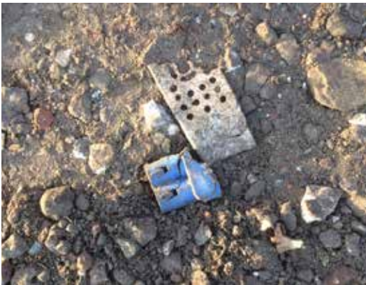
Met dit zogeheten menggranulaat worden in Brabant zandpaden verhard.

De les uit deze zaak is dat de begripsbepalingen goed moeten aansluiten bij het vergunningstelsel. De verbodsbepalingen zijn duidelijk, maar de begripsbepalingen bieden ruimte om onder het verbod uit te komen.