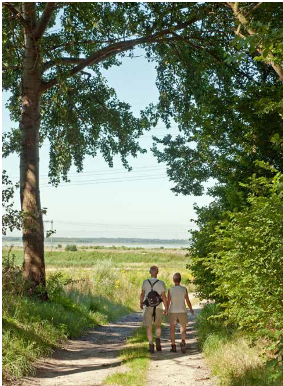
Je inzetten voor het behoud van zandpaden loont de moeite. Deze wandelaars genieten van zo'n 'trage weg' in de Brabantse Wal nabij Bergen op Zoom.