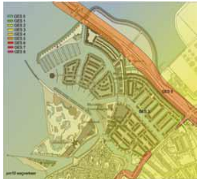
Stikstof door wegverkeer in Harderwijk in 2020