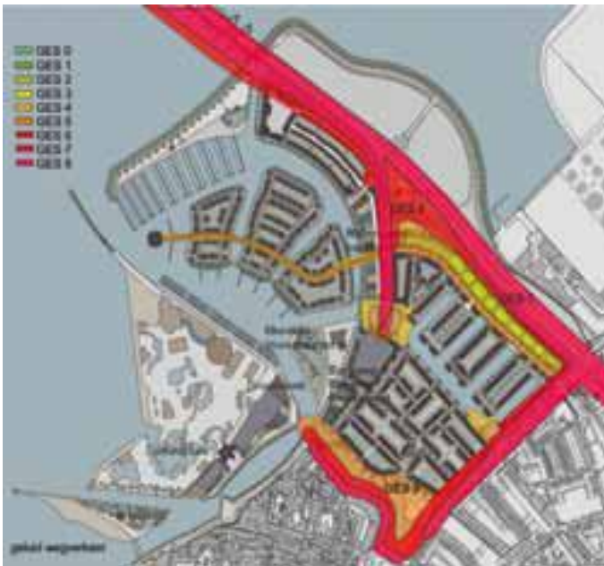
Geluid door wegverkeer in Harderwijk in 2020

Door historische groei zijn er in de binnenstad van Harderwijk onder andere problemen ontstaan op het gebied van de leefbaarheid, de bereikbaarheid en parkeermogelijkheden. De gemeente Harderwijk heeft het plan ontwikkeld om van een industrieterrein dat naast het oude stadscentrum ligt een gebied te maken voor wonen en recreëren. De industrie verhuist naar een gebied buiten de stad. In het plangebied worden woningbouw, de aanleg van een boulevard en een jachthaven en ondergrondse parkeermogelijkheden gerealiseerd. Een knelpunt wordt gevormd door de provinciale weg N302 die direct langs het gebied loopt. Het is mogelijk dat toekomstige bewoners last zullen krijgen van geluid en luchtverontreiniging. Daarnaast is het een route voor gevaarlijke stoffen waardoor ook externe veiligheid een rol speelt. De GGD heeft middels de GES-methodiek de gezondheidseffecten in kaart gebracht, zodat de gemeente in staat is om passende maatregelen te nemen en ook toekomstige bewoners een beter beeld kunnen krijgen van de gezondheidssituatie in het gebied.