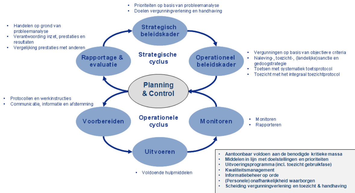
FIGUUR 1.1: BELEIDSCYCLUS MET PROCESCRITERIA OP HOOFDLIJNEN

Teneinde de kwaliteit van de uitvoering van VTH-taken op het gebied van het omgevingsrecht te verbeteren zijn kwaliteitscriteria – meer specifiek de set Kwaliteitscriteria 2.1 – vastgesteld. Naast procescriteria (big eight) worden ook eisen gesteld ten aanzien van deskundigheid en beschikbaarheid (vereiste opleidings-, kennis- en ervaringsniveau en de minimaal vereiste beschikbaarheid van ervaren deskundigen). 9